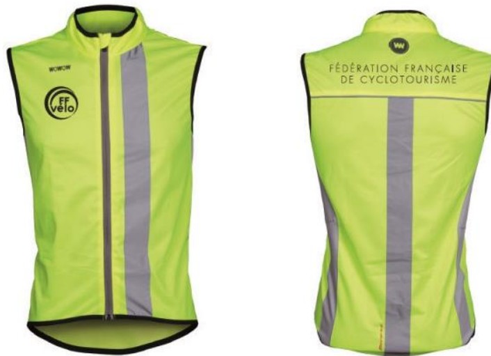
Gilet de haute visibilité